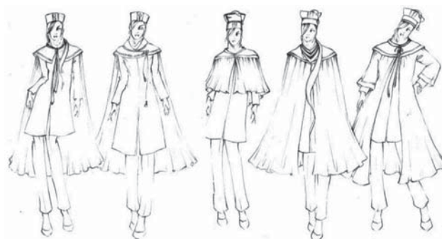
تصویر ۱ نمونه اتوهای اولیه طراحی لباس جشن فارغ التحصیلی

در بیشتر این نقش‌ها تمایل انسان به مار دیده می‌شود. یک مهر جالب توجه که اکنون در موزه ایران باستان نگهداری می‌شود و متعلق به هزاره چهارم ق.م. است، مهری بیضوی است که بر روی آن تصویرماری به صورت برجسته حک شده است.