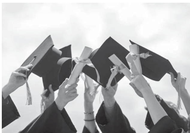
در نهایت لباس فرم فارغ التحصیلی با الهام از نماد مار طراحی می‌باشد.