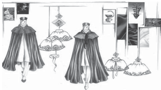
تصویر ۲ نمونه طراحی لباس جشن فارغ التحصیلی با الهام از نقش مار