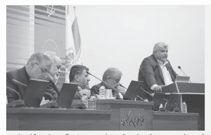
است و این موضوع واحدهای تولیدی را در زمینه نقدینگی دچار مشکل زیادی کرده است.

دستمالچیان با تأکید بر اینکه در استان یزد کارت بازرگانی حدود ۸۰ واحد تولیدی مسدود شده است، تصریح کرد: در این زمینه درخواست داریم که اختیارات استانداران افزایش یابد و آنها با شناختی که از واحدهای تولیدی دارند، نسبت به تصمیم گیری درباره آن اقدام کنند. سیاست انقباضی بانکها به شدت در حال اجرا