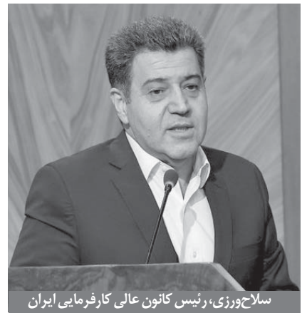
سلاح‌ورزی، رئیس کانون عالی کارفرمایی ایران

مسعود پزشکیان - رئیس‌جمهور - اظهار داشت: برای تدوین طرح کارشناسی در حوزه اقتصاد، کمیته‌ای با حضور نمایندگان بخش خصوصی، دانشگاه، صنعت،