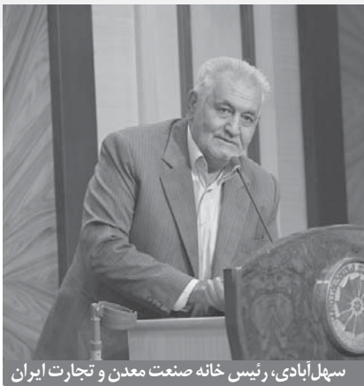
سهل آبادی، رئیس خانه صنعت معدن و تجارت ایران